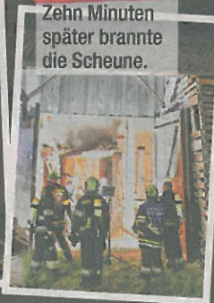
Brand 2 Zehn Minuten später brannte die Scheune.