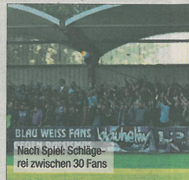
BLAU WEISS FANS Nach Spiel: Schlägerei zwischen 30 Fans

Fünf Verletzte, ein demoliertes Auto und zahlreiche Anzeigen – so die Bilanz nach einem Freundschaftsspiel zwischen Blau-Weiß-Linz und dem FC Chemnitz (D)