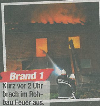
Brand 1 Kurz vor 2 Uhr brach im Rohbau Feuer aus.

fand nämlich eine Grillmeisterschafts-Feier statt, zahlreiche Nachtschwärmer waren unterwegs ■